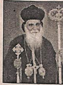
പ. ബസ്സേലിയോസ് ഔഗേൻ പ്രഥമൻ കാതോലിക്കാ ബാവ